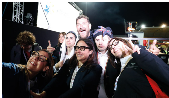
Il ministro Locatelli alla cerimonia di apertura allo stadio Guido Teghil di Lignano Sabbiadoro