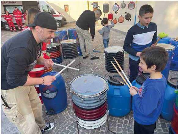
Uno dei momenti che ha visto la musica conquistare Caivano