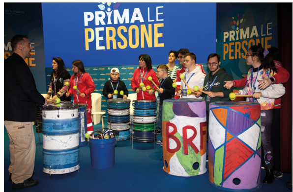
L'esibizione musicale dei ragazzi del progetto durante l'evento Prima le Persone a Ercolano il 31 marzo scorso, promosso dal ministro Locatelli