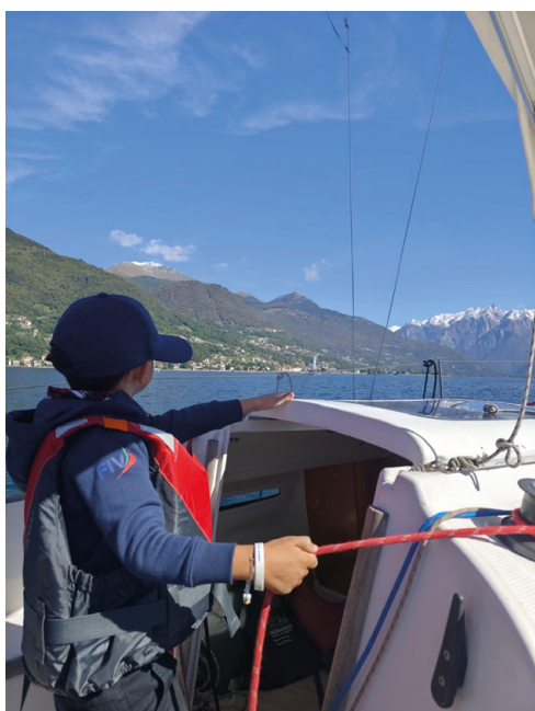
Una delle uscite in barca del progetto Velando

Il progetto lascia non soltanto i risultati di un’iniziativa nazionale, ma soprattutto una rete di relazioni, competenze e buone pratiche che potrà continuare a crescere nel tempo. Un’esperienza che ha mostrato come il mare possa abbattere barriere culturali e sociali, trasformandosi in uno spazio aperto dove ciascuno può trovare il proprio posto a bordo.