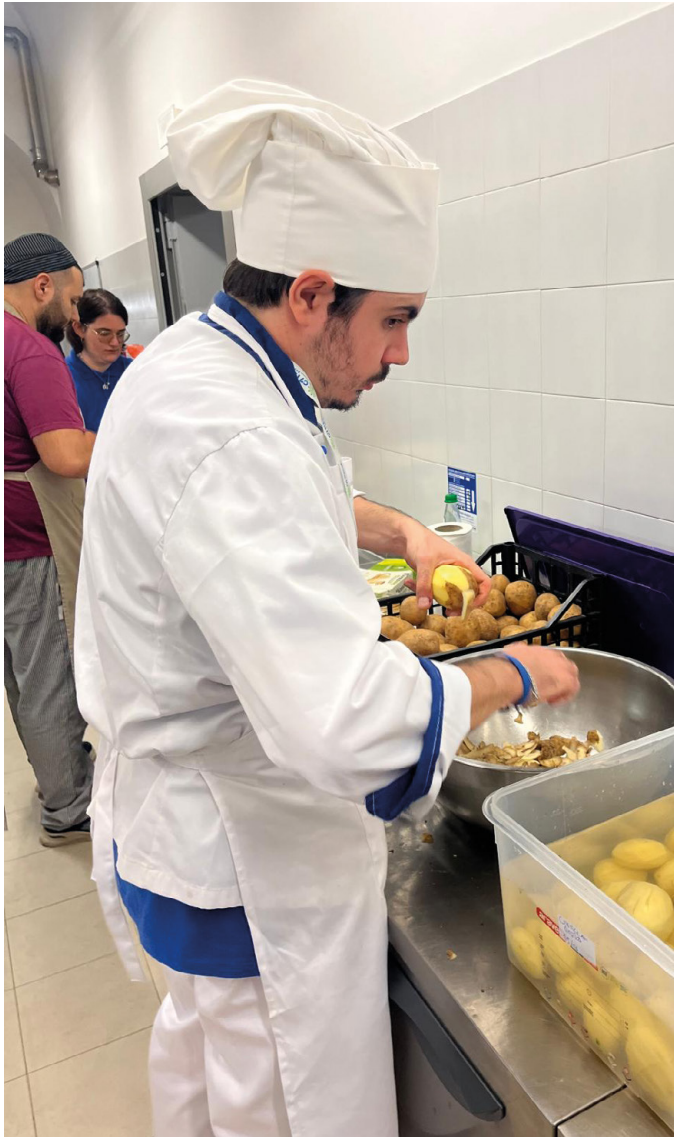
Luna Blu è anche ristorazione