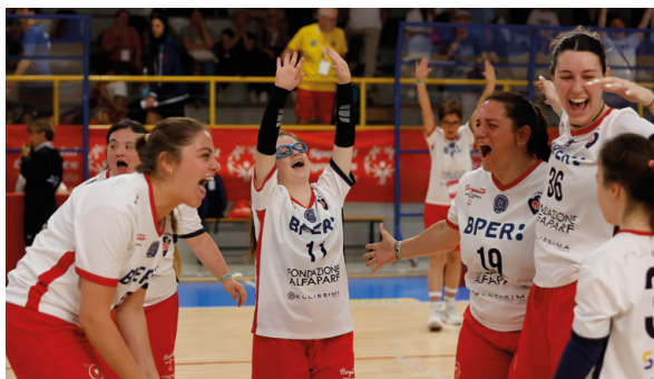
Un momento di esultanza e condivisione che testimonia il valore dello sport come strumento di inclusione e crescita personale