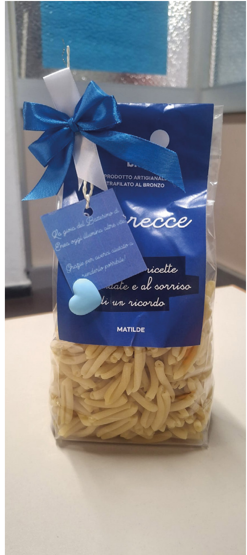
Una delle tipologie di pasta di Luna Blu