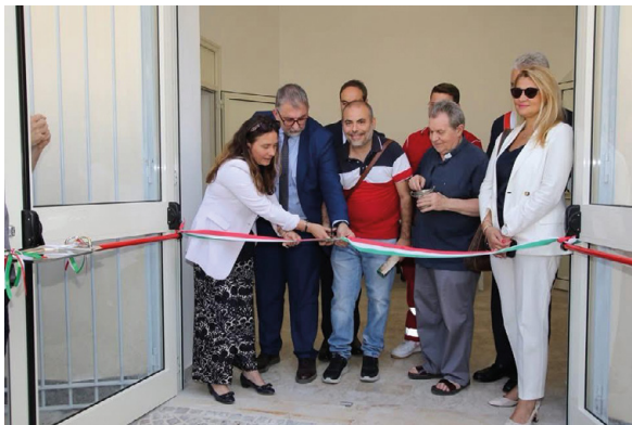
Il taglio del nastro dello Spazio dei talenti a Caivano il 5 luglio 2024