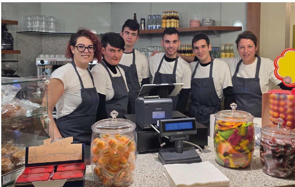
I ragazzi di Noi Genitori a Castelmarte nel bar appena riaperto