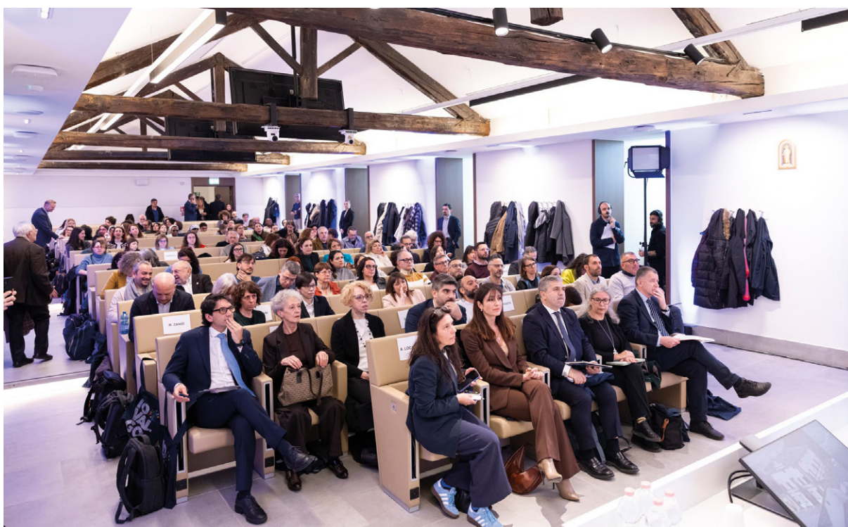
La platea del convegno Educatori ed educare - Una scelta di vita