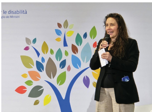
Il ministro per le Disabilità Alessandra Locatelli