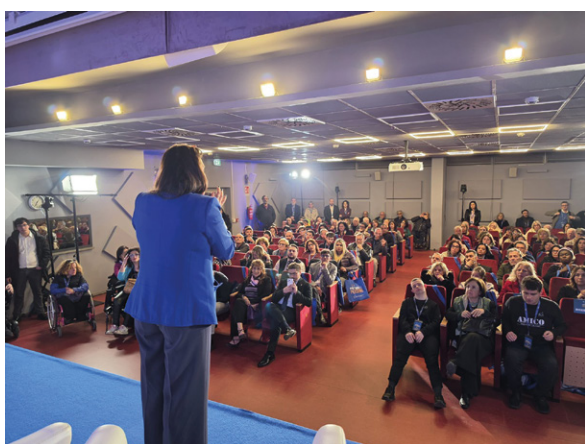
La prima tappa del tour Prima le Persone a Tor Bella Monaca a Roma

L'evento proseguirà in altre realtà in un percorso – che attraverserà il Paese – fatto di ascolto, incontro e condivisione, con l'obiettivo di dare spazio alle voci e alle esperienze di chi vive ogni giorno la disabilità. “Con questa iniziativa – ha aggiunto Locatelli – desidero mostrare ancora di più la mia vicinanza a tutti i contesti, agli ambiti, ai comuni e a ogni Persona, per trasmettere l'importanza di adottare un nuovo sguardo, per essere più forti insieme e per crescere, come comunità coese, vedendo in ogni Persona le potenzialità e non i limiti”. Il secondo appuntamento si è svolto, invece, al Centro Don Orione di Ercolano, in provincia di Napoli.