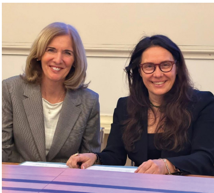
Il ministro Alessandra Locatelli e Theresa Hamlin, presidente e Ceo di The Center for Discovery

Secondo il ministro, il confronto con una realtà di eccellenza come The Center for Discovery rappresenta “uno stimolo ulteriore alla crescita e al consolidamento di reti internazionali orientate alla tutela dei diritti delle persone con disabilità e alla promozione dell'autonomia e della vita indipendente”.