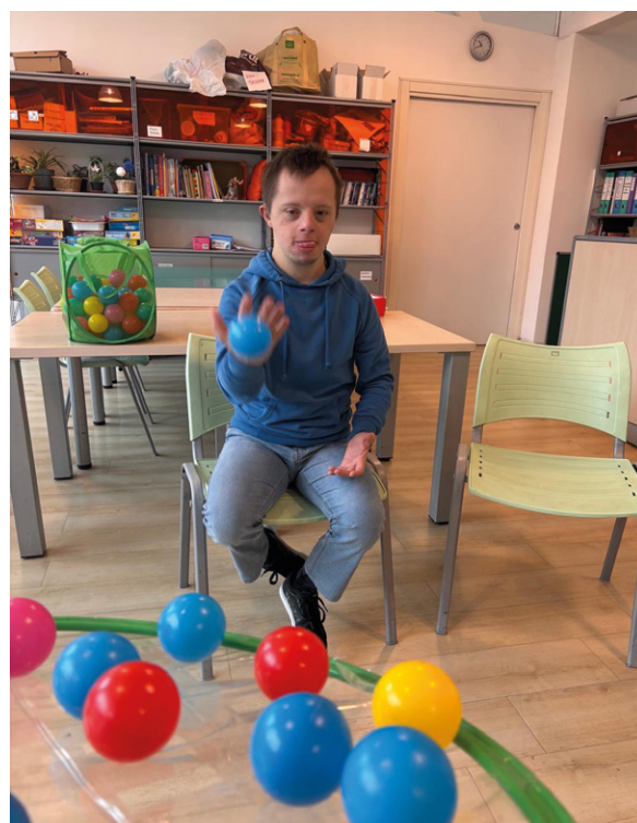
Un ragazzo di Noi Genitori durante un'attività in sede