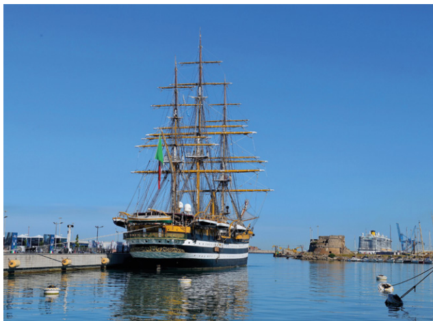
Il veliero Amerigo Vespucci al porto di Civitavecchia

A luglio, infatti, la nave attraccherà a New York, nell'occasione a risonanza mondiale dei festeggiamenti per il 250° anniversario della dichiarazione di indipendenza americana. Numerose associazioni e persone con disabilità avranno nuovamente modo, questa volta sotto gli occhi di tutto il mondo, di rappresentare le eccellenze italiane nell'arte, nella musica, nel cibo, attraverso la valorizzazione dei talenti e delle competenze di tutti.