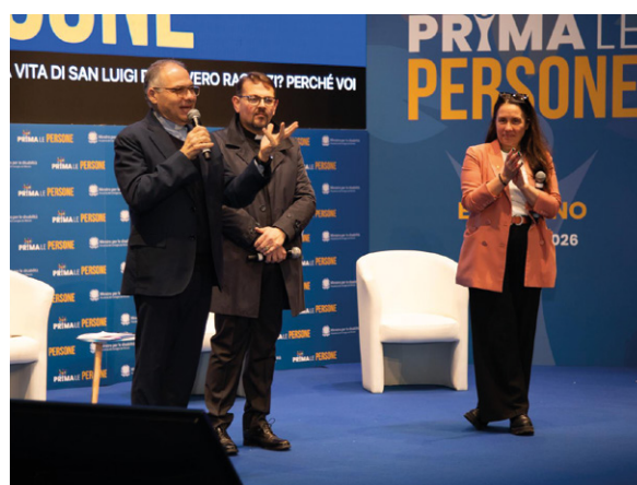
Il secondo appuntamento del tour Prima le Persone al Don Orione a Ercolano, in provincia di Napoli