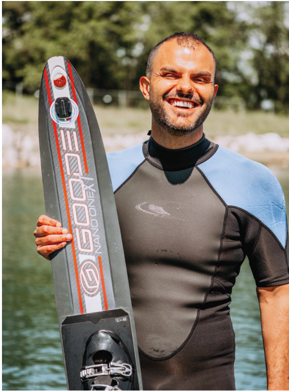
Daniele Cassioli, 39 anni, atleta paralimpico di sci nautico, 28 volte campione del mondo