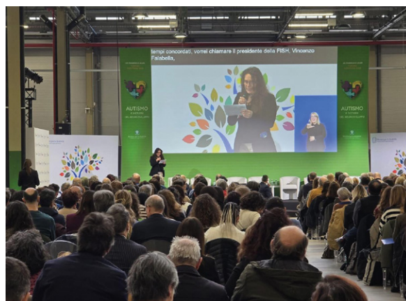
Un momento del convegno Autismo e disturbi del neurosviluppo a Torino