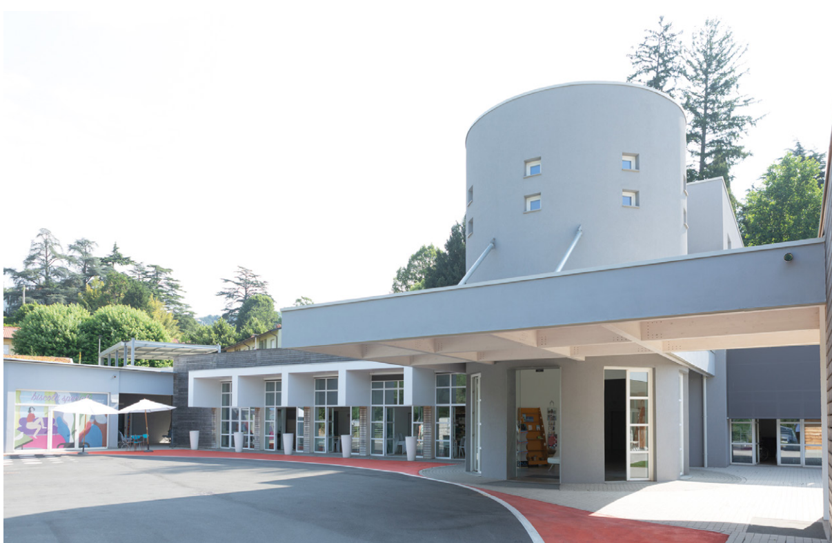
La sede di Noi Genitori cooperativa sociale a Erba

Insomma, tra serre per la coltivazione dei fiori (ce ne sono due nel giardino della sede), attività motorie e artistiche, comunicazione aumentativa, piscine, laboratori e volontariato d'impresa, il filo conduttore resta uno: costruire inclusione reale, dentro e fuori le mura della cooperativa.