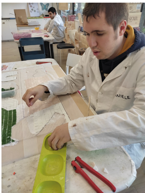
Uno dei ragazzi di Cascina San Vincenzo mentre lavora nell'Officina del mosaico