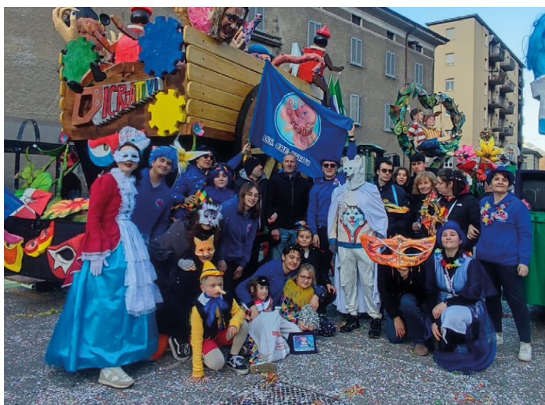
I Cre-Attivi con i ragazzi de Il Tralcio al Morbegno Carneval 2026

Non solo un laboratorio artistico, ma un percorso umano. Attraverso la manualità, il colore e la creatività, i partecipanti hanno condiviso tempo, idee ed emozioni, dimostrando come l'arte possa diventare uno strumento concreto di inclusione e relazione. Il 15 febbraio scorso, durante il Morbegno Carneval, i ragazzi de Il Tralcio hanno sfilato insieme al gruppo I Cre-Attivi, partecipando attivamente alla coreografia e vivendo in prima persona l'esperienza del carro allegorico. "In un'epoca in cui l'inclusione è una priorità culturale e istituzionale – spiegano i ragazzi de I Cre-Attivi –, iniziative come questa dimostrano come anche un gruppo di giovani possa generare un impatto significativo sul territorio, promuovendo valori di partecipazione, integrazione e crescita collettiva".