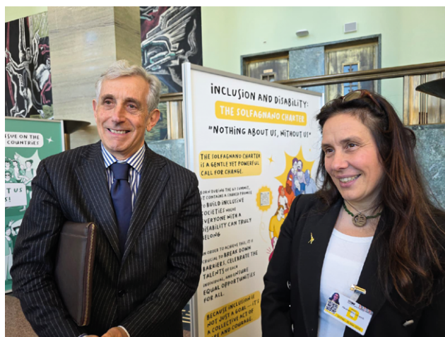
Il ministro Alessandra Locatelli e l'ambasciatore Luigi Maria Vignali, Rappresentante Permanente a Ginevra