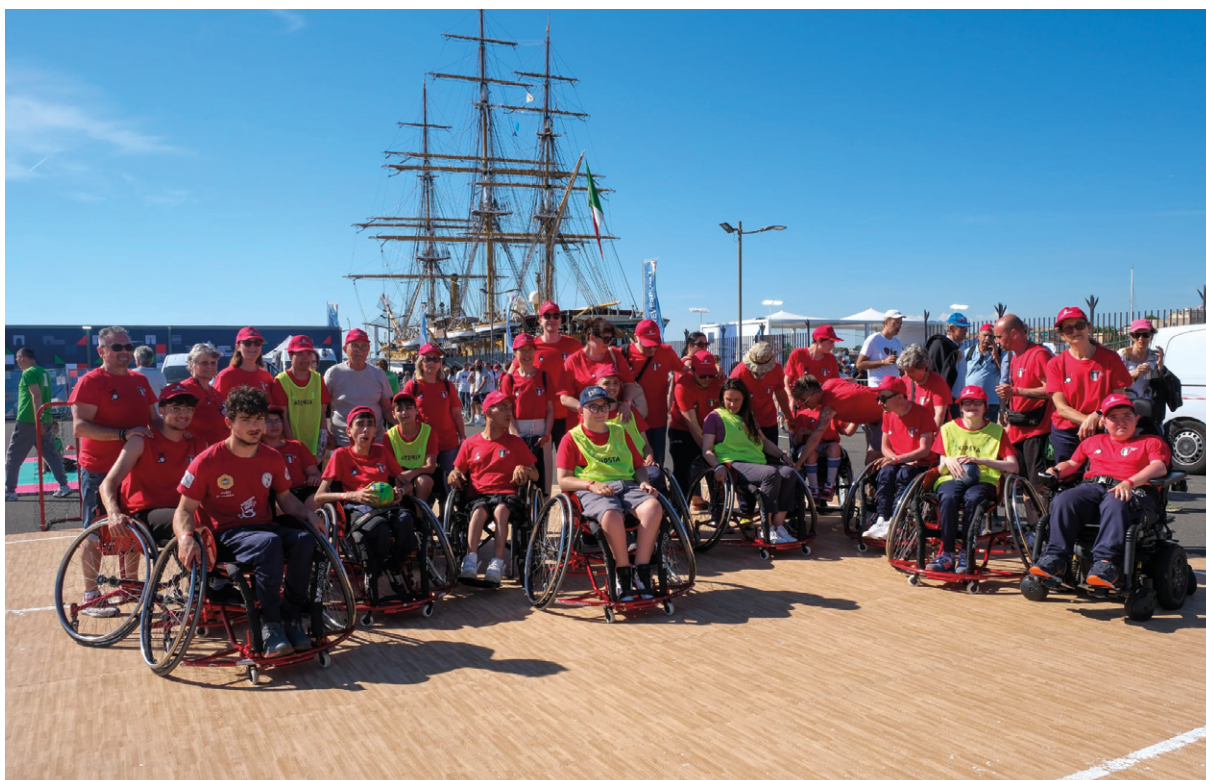
Pallamano a Ruota Libera con il ministro Locatelli alla tappa di Civitavecchia del tour Mediterraneo del veliero Amerigo Vespucci