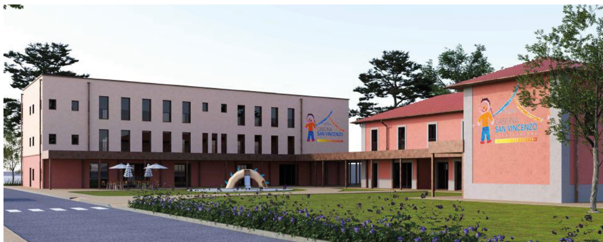
Il render del polo dell'autismo Aut evolution

“Non vogliamo creare un progetto autistico chiuso – sottolinea Rivolta – ma un luogo di incontro, integrazione e crescita aperto e di massima interazione con tutto il territorio”. Questa è la cifra più autentica di Cascina San Vincenzo: trasformare la fragilità in risorsa, e l'autismo in un progetto di vita possibile.