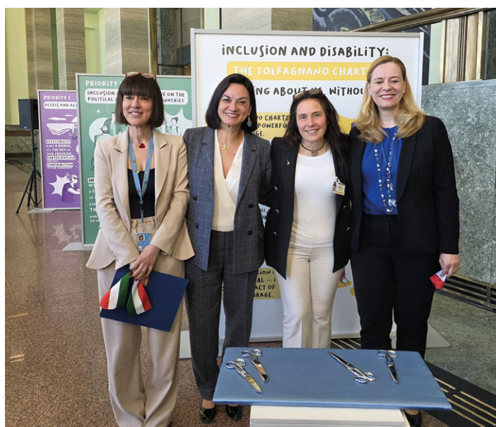
Il taglio del nastro, al Palais des Nations a Ginevra, della mostra itinerante Inclusion and Disability: The Solfignano Charter "Nothing about us, without us"

La Carta di Solfignano arriva anche nelle scuole attraverso un progetto-concorso, voluto dal ministro Locatelli, in collaborazione con il ministro Valditara, con l'obiettivo di promuovere i principi e gli impegni sottoscritti dai Paesi G7. Gli Uffici scolastici regionali hanno individuato le scuole primarie e secondarie di secondo grado particolarmente impegnate sui temi dell'inclusione e che si sono distinte nella realizzazione di buone ed efficaci pratiche. Le scuole selezionate realizzeranno un elaborato, eventualmente accompagnato da un video della durata massima di 5 minuti, da inviare entro il 30 aprile 2026. Le classi vincitrici avranno l'opportunità di partecipare all'evento ExpoAid 2026 "Io, Persona di valore", in programma a Rimini dal 25 al 27 giugno, durante il quale si svolgerà la cerimonia di premiazione del progetto-concorso. Le scuole vincitrici riceveranno un contributo di 2.500 euro ciascuna, messo a disposizione dal ministero per le Disabilità, destinato all'attuazione di un progetto per l'inclusione scolastica ispirato ai principi della Carta di Solfignano.