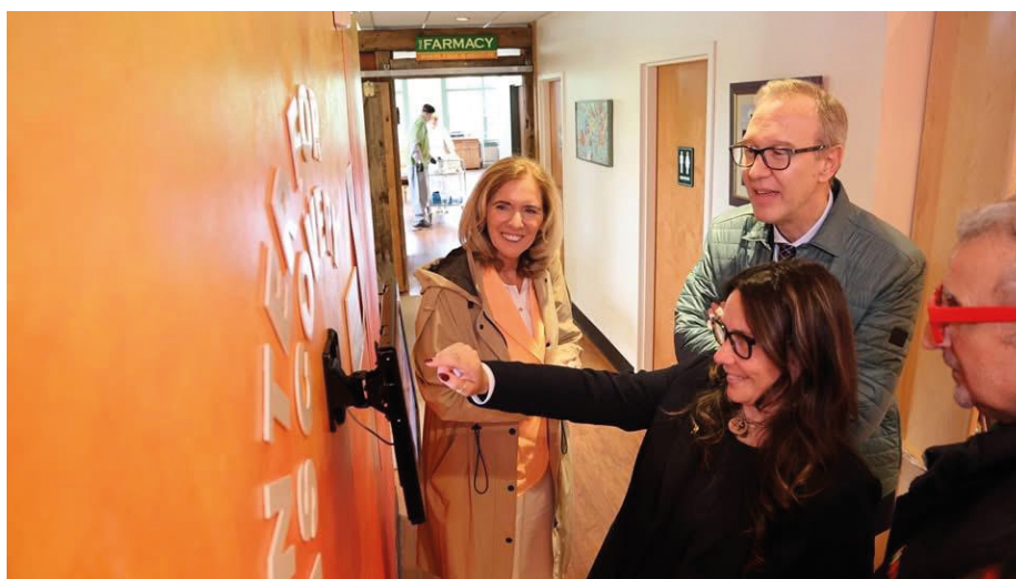
Il ministro Alessandra Locatelli lo scorso giugno al The Center for Discovery

La visita presso il Center for Discovery ha rappresentato un'esperienza di elevato valore scientifico e istituzionale, confermando l'importanza di modelli di presa in carico che pongano al centro la persona con disabilità grave all'interno di un sistema integrato di servizi e contesti. Il modello osservato infatti integra le dimensioni corporee e neuro-funzionali, riconoscendo come il benessere fisico sia strettamente intrecciato al benessere psicologico e ai processi di regolazione. La strutturazione ecologica degli spazi e delle attività, seguendo criteri evidence-based, poggia su uno spirito di ricerca-azione che permette di adattare nel tempo i servizi al Progetto di vita della persona.