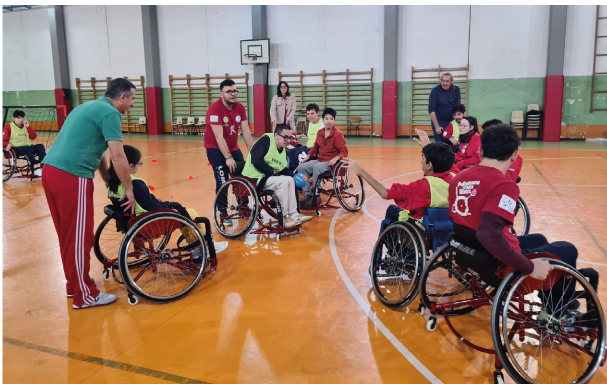
In palestra, a Prato, durante una sessione di allenamento